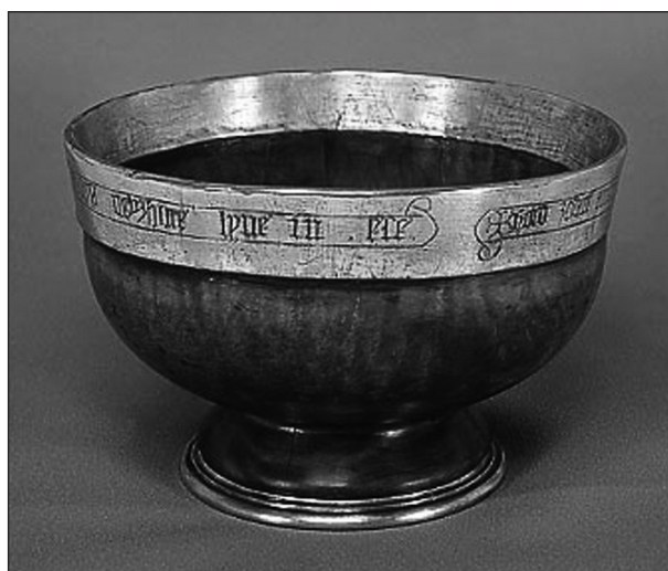
Obr. 1 Nádobu Mazer z javorového dreva s obrubami z pozláteného striebra, pochádzajúca z roku 1380 [12]