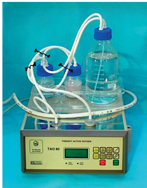
Obr. 1 Ozonizátor TAO 80 pro přípravu ozónované vody

Po vstupním vyšetření a stanovení diagnózy ošetřující lékař vyplnil formulář „Záznam vyšetření a ošetření“. Při diagnóze alveolitis sicca byla extrakční rána pomocí stříkačky naplněna ozónovanou vodou v množství, které vyplnilo zubní lůžko, nechala se působit jednu minutu a poté se odsála sterilním tamponem. Následně byl do extrakční